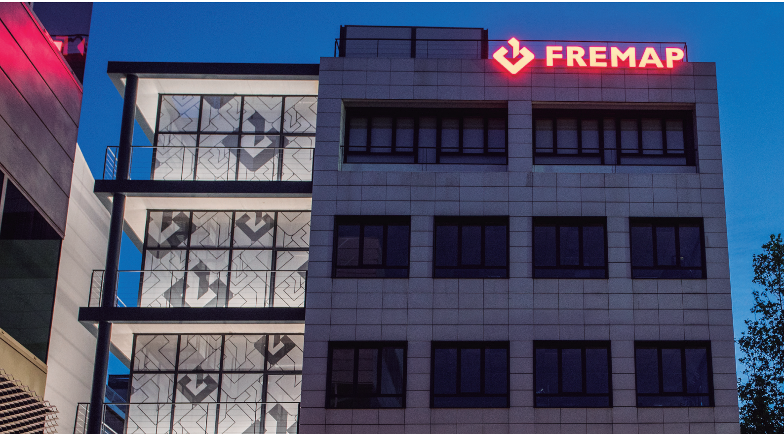
Oficina de Madrid -Alcalá