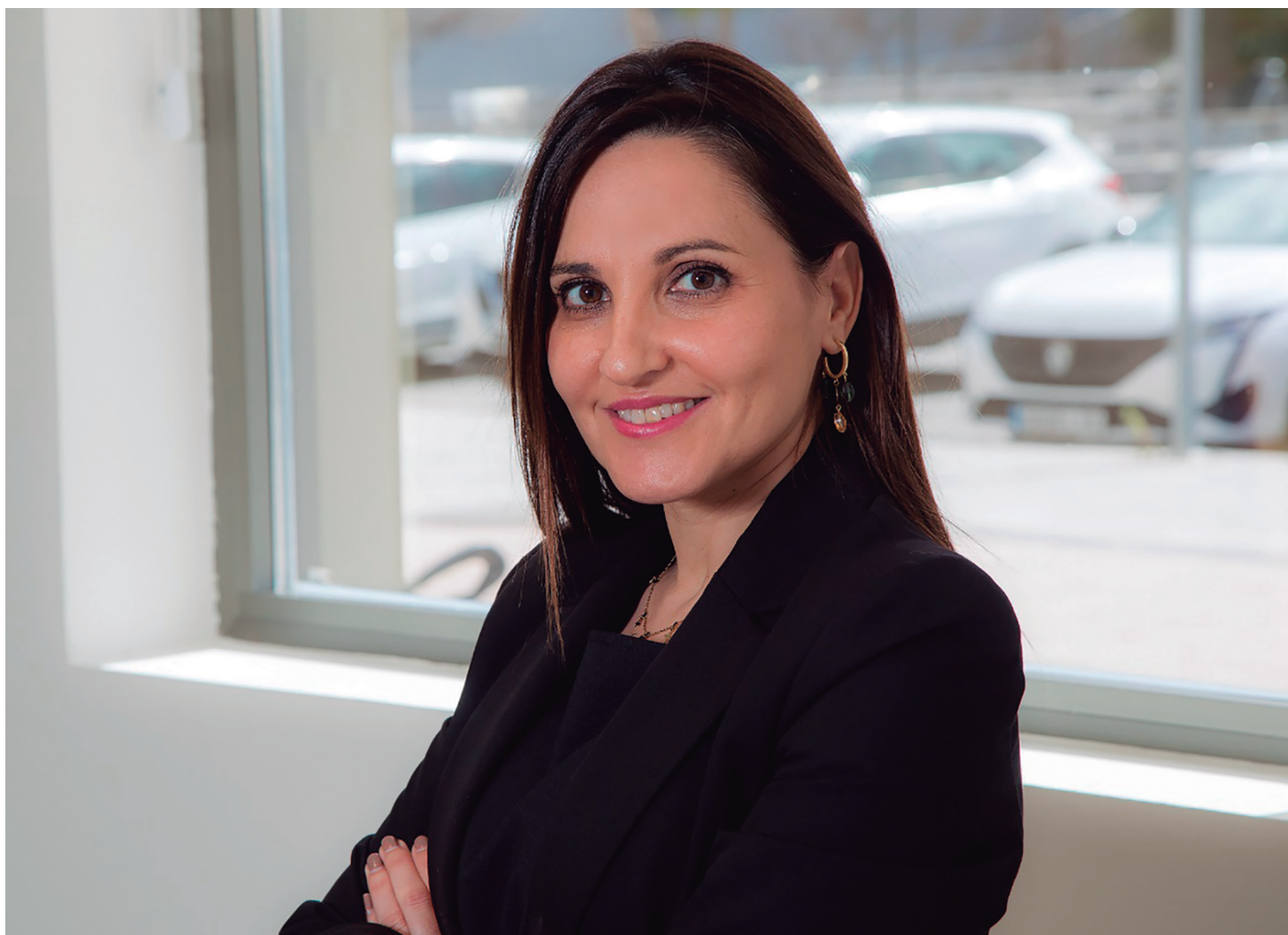
Empleada Oficina de Navalmoral

El Convenio Colectivo de FREMAP, actualmente vigente, mejora medidas orientadas a favorecer la conciliación de la vida familiar, personal y laboral, respecto de las recogidas en el ámbito del sector por el Convenio Colectivo General de Ámbito Estatal para Entidades de Seguros, Reaseguros y Mutuas Colaboradoras con la Seguridad Social.