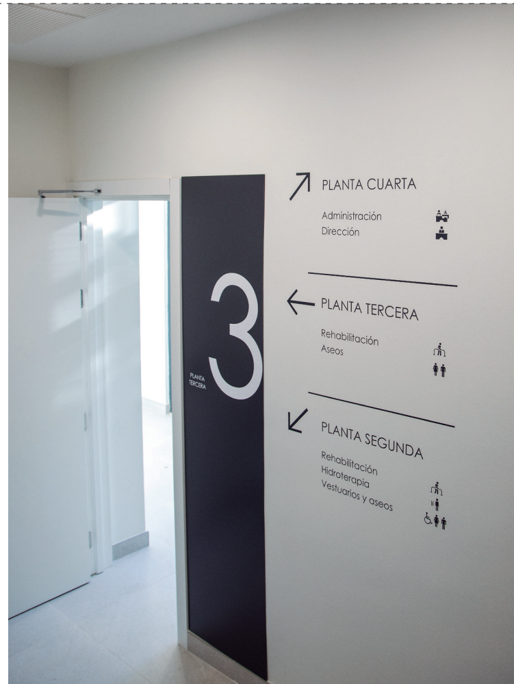
Oficina de Madrid- Alcalá

El trabajo realizado por el Servicio de Auditoría Interna es valorado por los centros auditados mediante el registro opcional de una encuesta que se remite junto con el informe de auditoría a dichos centros auditados, siendo la valoración obtenida en este ejercicio 2022 de 4,50 puntos (sobre 5 posibles).