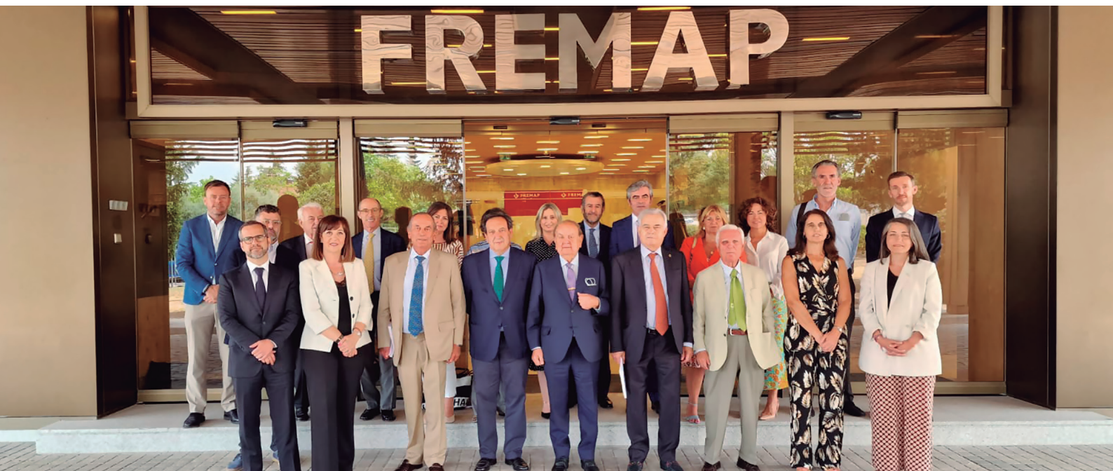
Junta General 2022

FREMAP, Mutua Colaboradora con la Seguridad Social N.º 61 (anteriormente denominada "Mutua de Accidentes de Trabajo y Enfermedades Profesionales de la Seguridad Social N.º 61") viene desarrollando su actividad, con el nombre de MAPFRE, desde el 9 de mayo de 1933, siendo confirmada su actuación con ámbito nacional, por Resolución de la entonces Dirección General de Previsión de 13 de marzo de 1969. Asimismo, mediante Resolución de la Dirección General de Ordenación Jurídica y Entidades Colaboradoras de la Seguridad Social de 25 de Julio de 1991, se autorizó el cambio de denominación social por el actual de FREMAP.