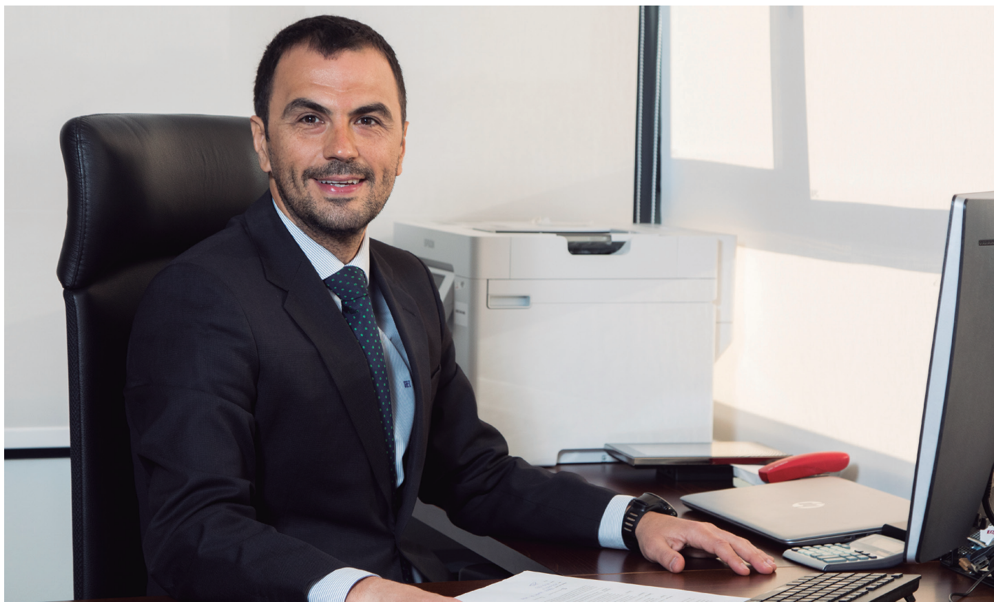
Empleado Oficina de Madrid- Alcalá