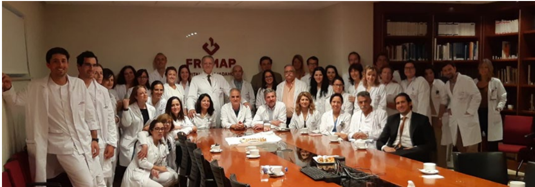
Foto: Sesión Clínica año 2019